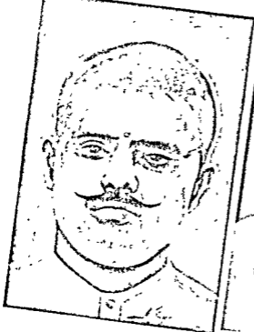
रामप्रसाद बिस्मिल कामी 19 दिगम्बर, 1927